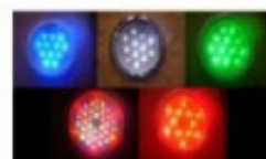
Set di luci della cromoterapia