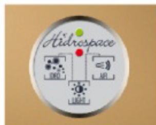
Comando di accensione digitale