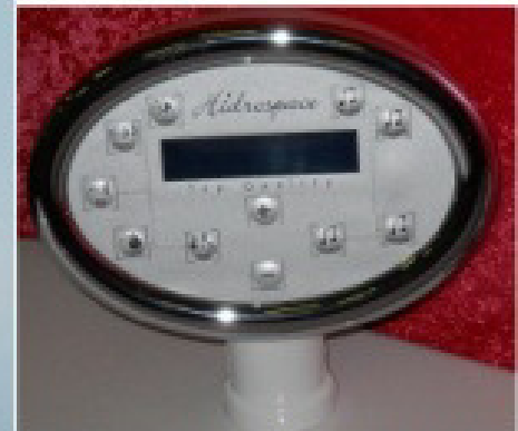
Pannello di controllo Tempo di funzionamento idro Memory Program radio regolazione pressione elettr.