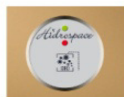
COMANDO DIGITALE DI ACCENSIONE