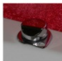
REGOLATORE DI PRESSIONE